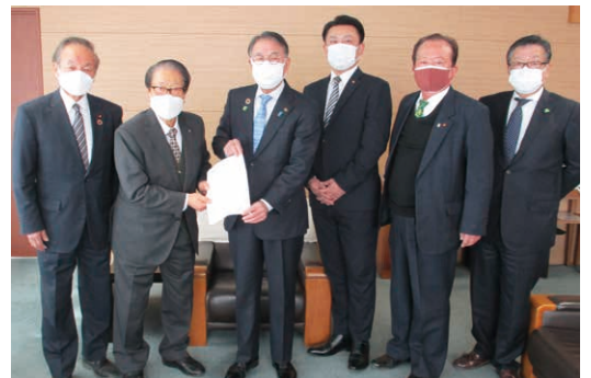
内容 施設園芸農家に対するハウス燃料(A重油)価格高騰に対する助成措置を講ずること